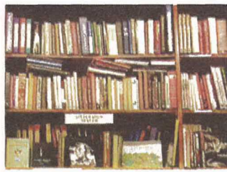
Vem ska äga?

in i någon dammig bokhandel på vischan sörjer väl inte direkt att bokhandlarna blir färre. Men det finns vitala motbilder – som Sörlins i Rättvik. Det måste märkas på hyllorna att ägarna bryr sig. Jan Eklund